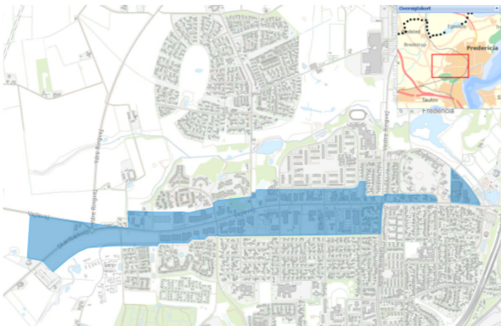
Aflastningsområde i Fredericia Vest

Det ønskes at udvide kvoten med 10.000 m 2 til butiksareal. Kommuneplantillægget har været sendt i forudgående offentlig høring i december 2021, hvor der indkom 6 bemærkninger.