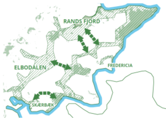
Illustration: Landskabet, der omgiver Skærbæk, i relation til hele kommunen.

Planen er bygget op omkring 5 fokusområder, der former en fortælling om et fællesskabsorienteret og inkluderende lokalsamfund, hvor det omgivende landskab samt relationen til naturen og vandet spiller en afgørende rolle for byens særlige identitet og dens fremtidige udvikling.