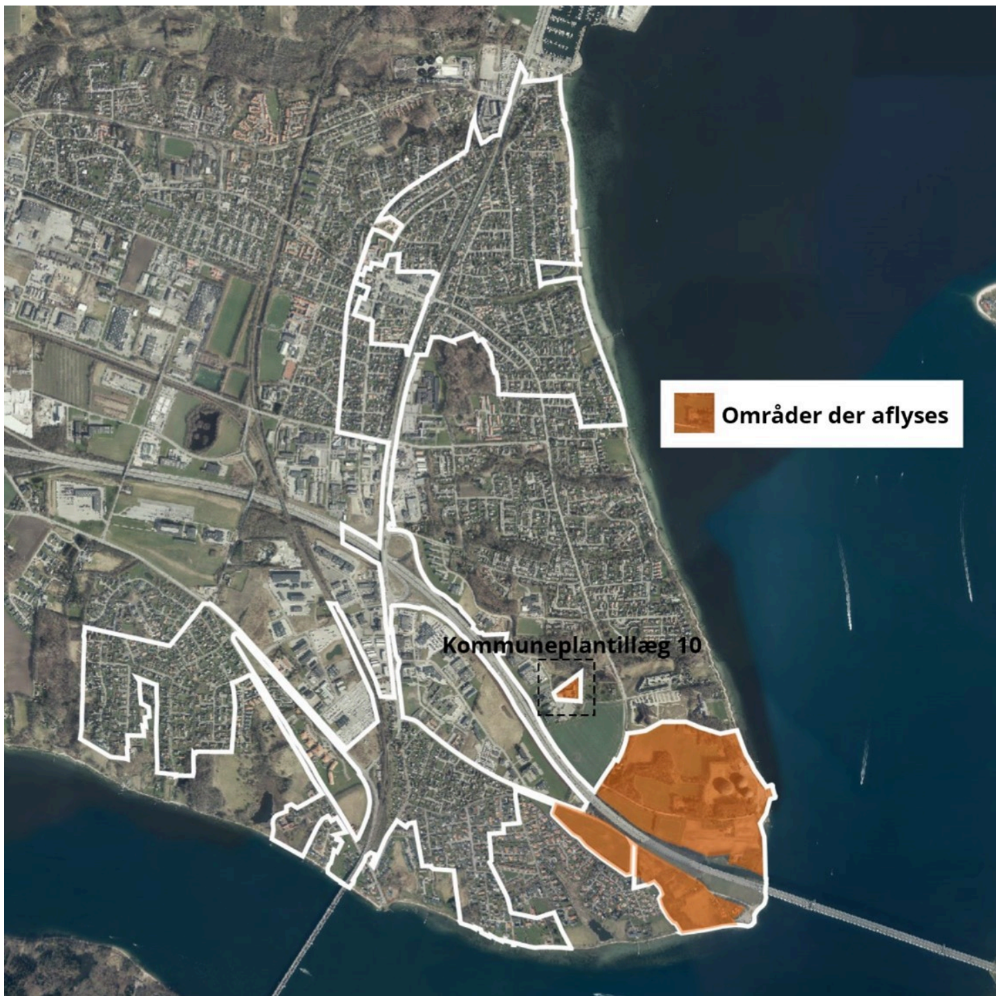
1- Kortet viser afgrænsningen for Byplanvedtægt 1 (hvid streg). De orange områder viser hvor byplanvedtægten ophæves.