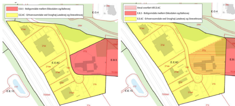
Specifikke rammer før kommuneplantillægget.